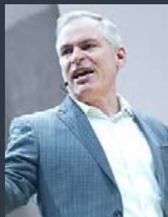
Pat Lencioni LEADERSHIP