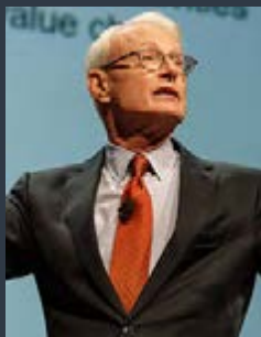
Michael Porter STRATEGY

Aprenda de los líderes de negocio más exitosos del mundo