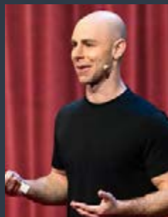
Adam Grant ORGANIZATIONAL CULTURE