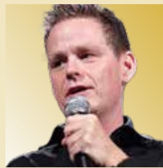
Daniel Goleman Inteligencia Emocional