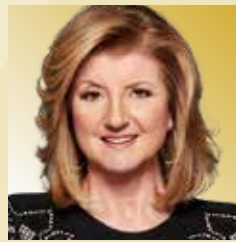
Indra Nooyi Transformación Empresarial